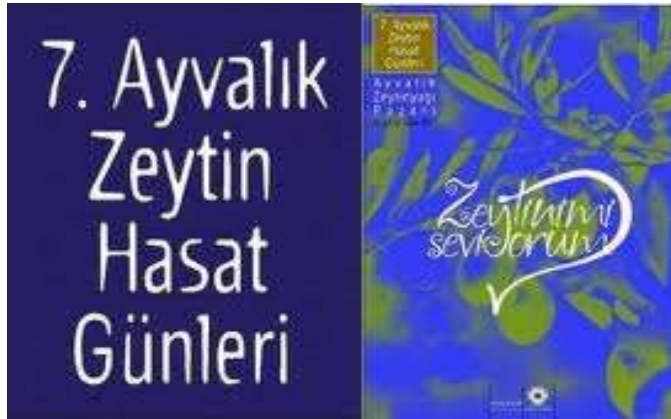
LES JOURS DE MOISSON A AYVALIK - 7