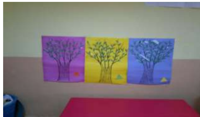
Les activités éducatives et promotionnelles pour les enfants